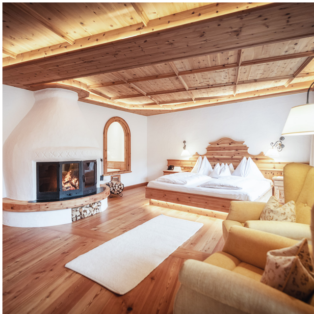
Your 'home' at the Stanglwirt