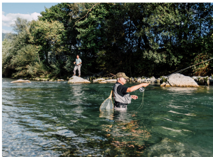
Private fishing grounds