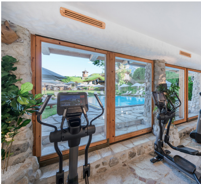
Fitnessgarden & Hypoxic chamber