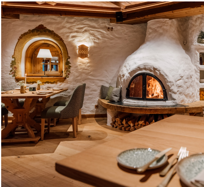
Leni's – a culinary journey