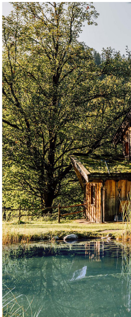
Private Chalet Hüttingmoos