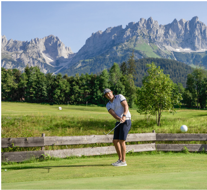
The emperor's golf-paradise