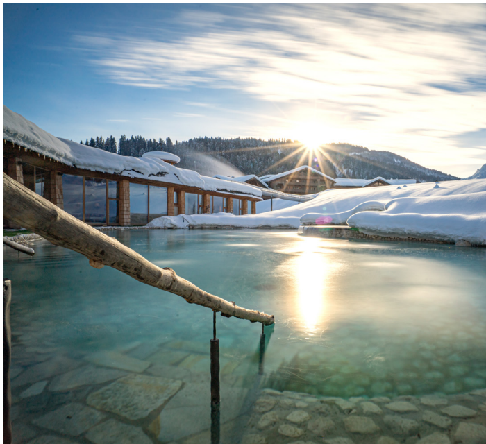
A snowwhite fairytale in the heart of Tyrol