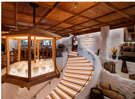
Leni's – Kulinarik mit Geschichte