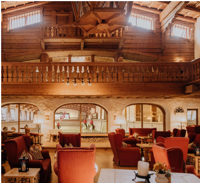
Rendezvous at the Hotelbar 'Tenne'