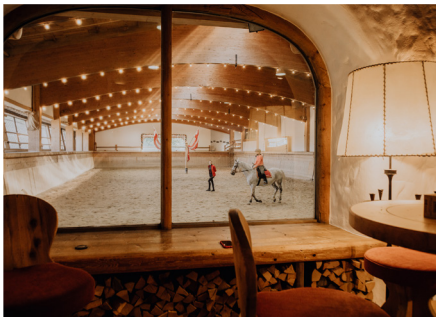
Rendezvous auf der „Tenne“