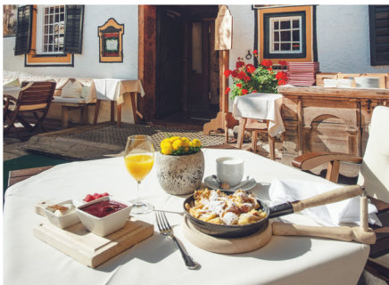
Traditionelle Momente im „Gasthof Stangl“