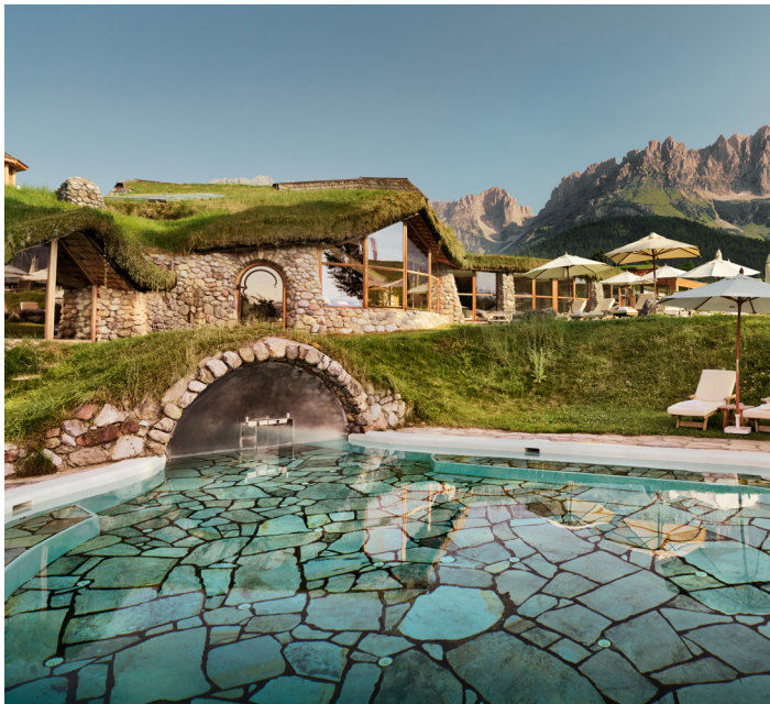
Experience the Stanglwirt water-elixer