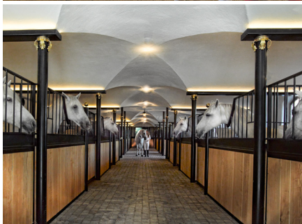
Riding experiences on majestic Lipizzans