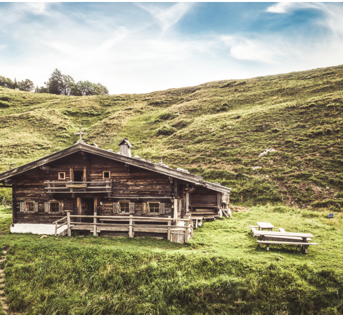
Auf der Stangl-Alm