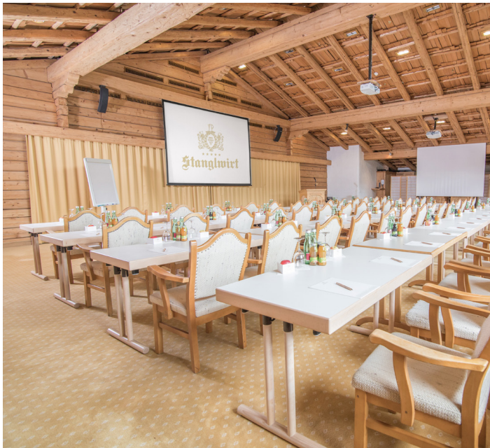
Conferences and Incentives