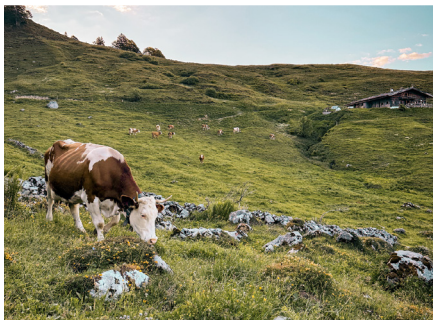
On the Stangl-Alm