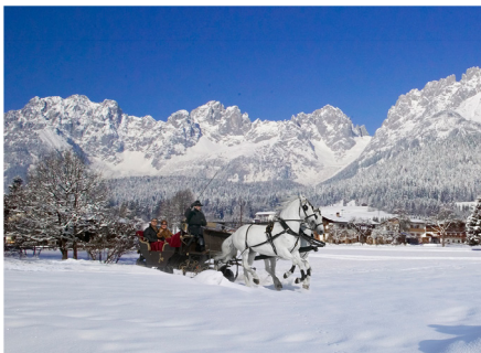
Ein schneeweißes Märchen im Herzen Tirols