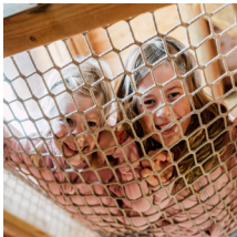
Joyful moments at the Children's Farm