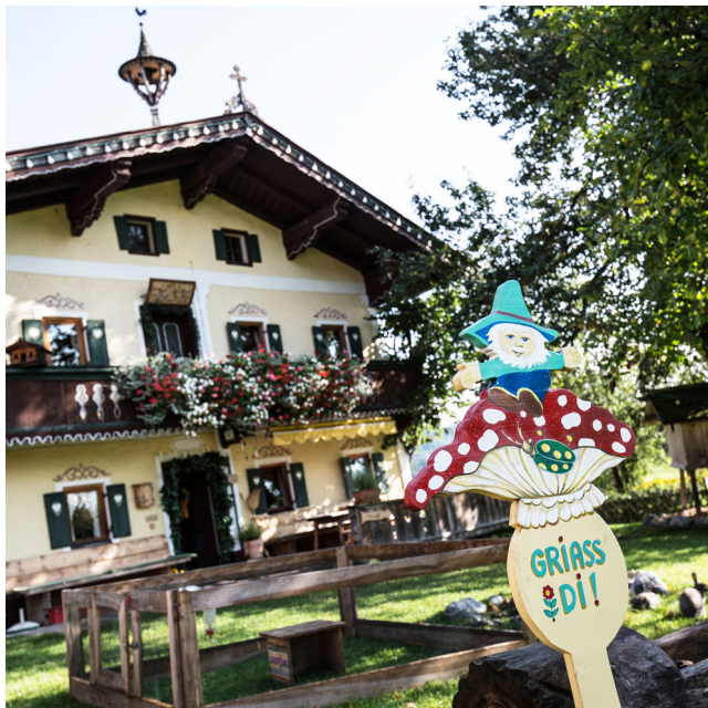
Kinderaugen strahlen am Kinderbauernhof