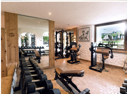
Fitnessgarten & Höhenkammer