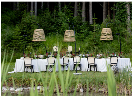
Tagungen und Incentives