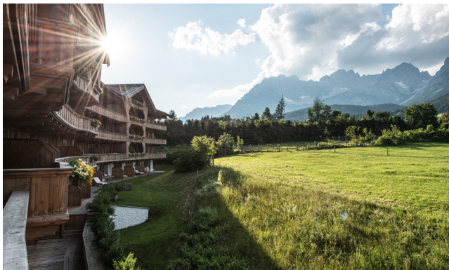
Des Kaisers schönster Anblick / Stunning mountains views