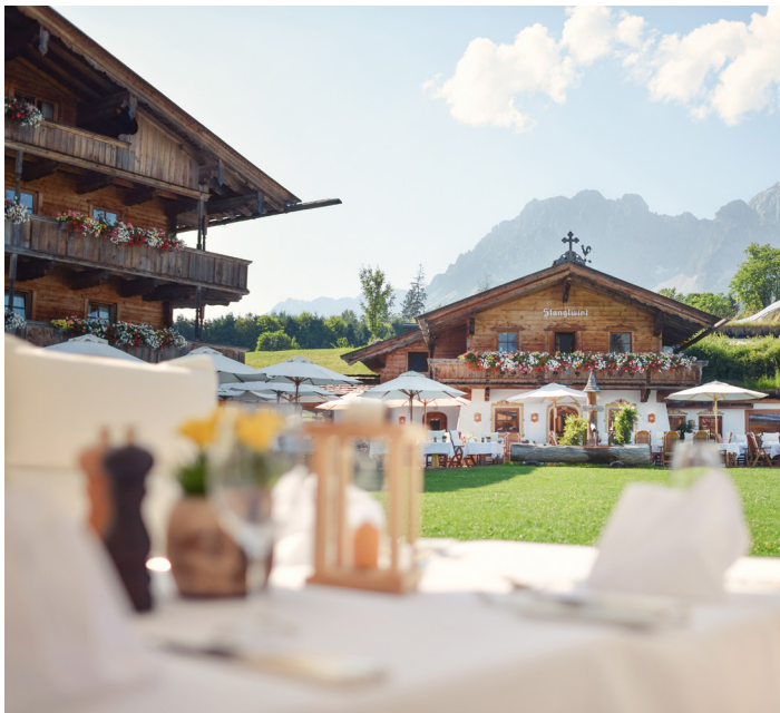
Culinary pleasures with exceptional views