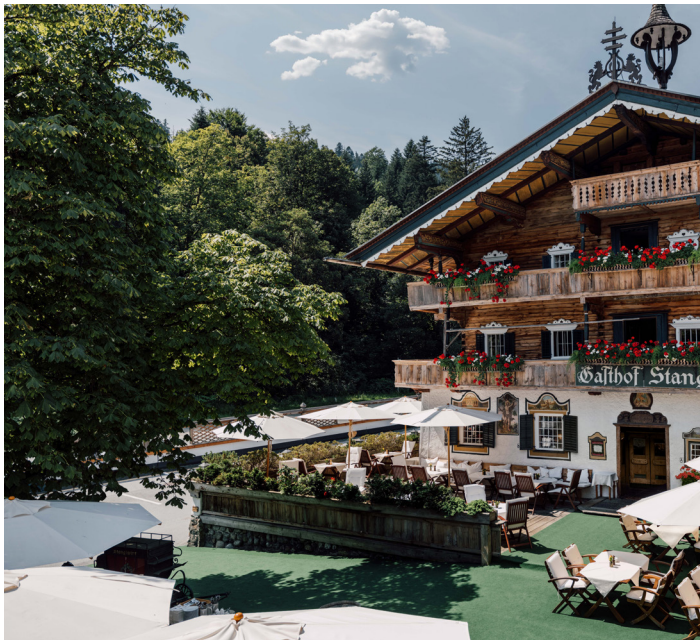
Traditional moments in the 'Gasthof Stangl'